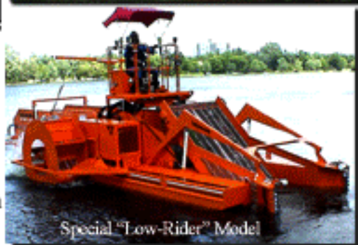
Special "Low-Rider" Model

Aquamarine Wisconsin 1444 S. West Ave., Waukesha, WI 53189 262-547-0211 Fax: 262-547-0718 pnogalski@weedharvesters.com